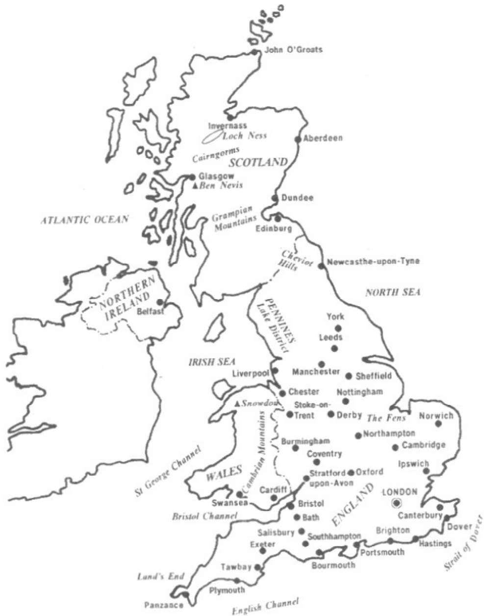
The United Kingdom of Great Britain and Northern Ireland

The word “Britain” derives from “Britannia”, the name given by the Romans to the area which is now England, Scotland and Wales. In 1603 one king came to rule England, Scotland and Wales, and the island became known as Great Britain. In 1801 Ireland officially came under British rule and England, Scotland and Wales and Ireland became known collectively as the United Kingdom of Great Britain and Ireland. In 1937 Southern Ireland was established as Eire, as independent sovereign state. And the United Kingdom became known as the United Kingdom of Great Britain and Northern Ireland .