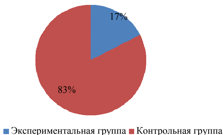
Рис. 2. Успешность восприятия на слух слов квазиомонимов в экспериментальной и контрольной группах (в %).

Пример оформления рисунка представлен ниже.