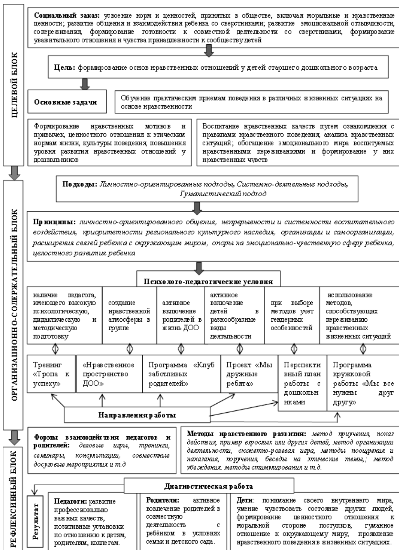
Рис. 1 Модель технологии формирования нравственных отношений у детей старшего дошкольного возраста