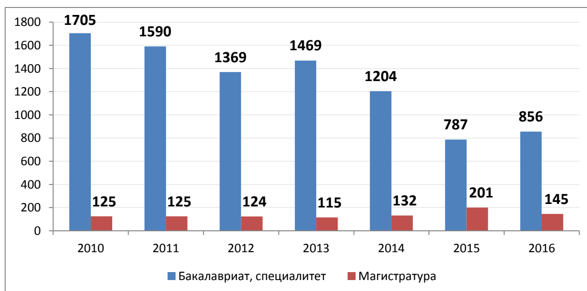
Рисунок 1. Динамика контрольных цифр приема по УГС «Образование и педагогические науки» (образовательные организации ВО)