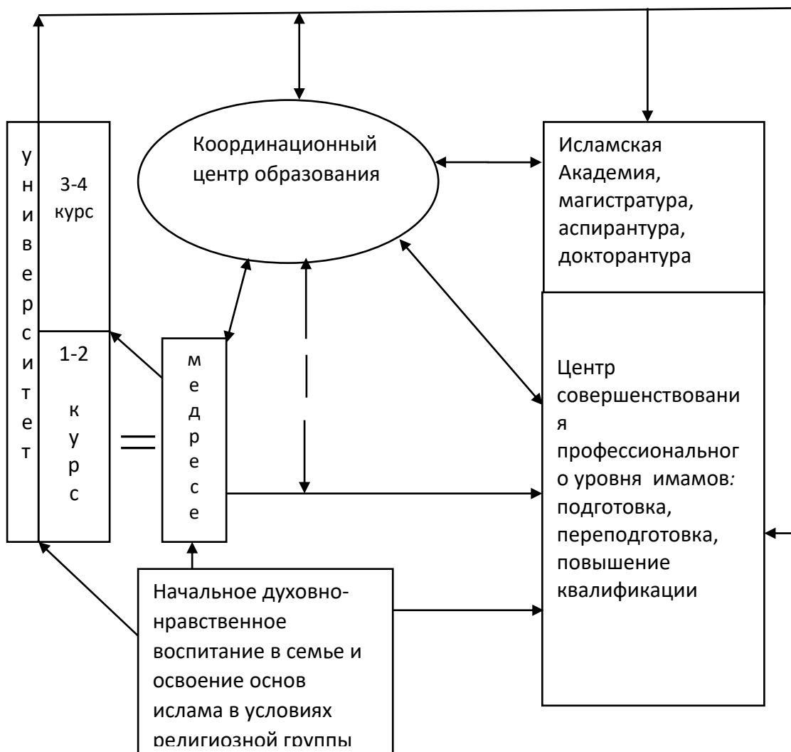
Рис.3. Модель современного отечественного исламского образования

религиозной группы при мечетях является важной составляющей исламского образования и выполняет роль подготовительной ступени образования мусульман.