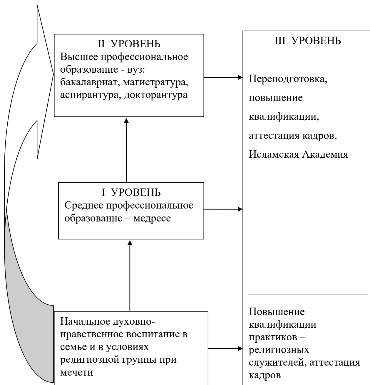
Рис. 2. Структура современного исламского образования

особенности организации трёхуровневой системы исламского образования представлены в следующих работах автора [10-16].