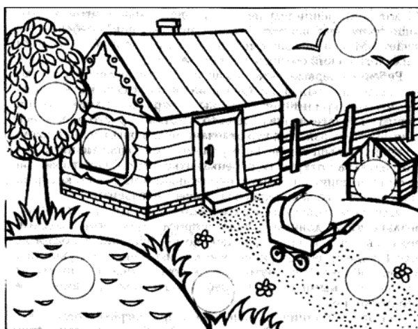
Рисунок 1. – Для методики «Где чье место?»

Второй уровень: особых проблем при выполнении этого задания дети испытывать не будут. Они легко поставят кружочки с персонажами на «чужие» места, однако объяснение будет вызывать у них трудности. Некоторые даже начнут ставить фигурки на их места, как только экспериментатор попросит рассказать, почему тот или иной персонаж очутился на неподходящем месте.