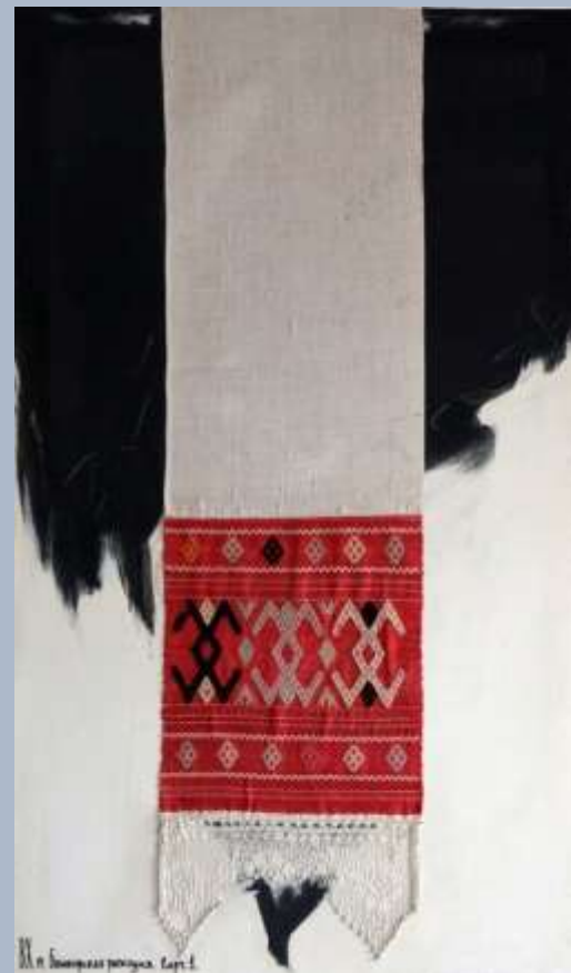
Василь Ханнанов. Башкирская рапсодия