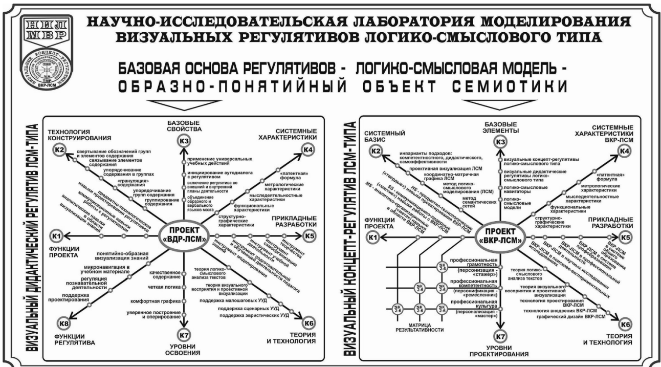
Рисунок 2 – Логико-смысловая модель как основа визуальных дидактических регулятивов

В ходе решения поставленных задач Научной лабораторией моделирования визуальных регулятивов логико-смыслового типа [7] выполнялось обоснование структуры, логической организации и внешнего вида предлагаемого визуального дидактического регулятива, проектируемого с помощью метода логико-смыслового моделирования учебного материала [9]. Были разработаны базовые структуры – логико-смысловые модели и реализованы на их основе два вида визуальных дидактических регулятивов (рис. 2): предназначенных для применения непосредственно в процессе учения, и предназначенных для проектирования педагогических объектов [10; 11].