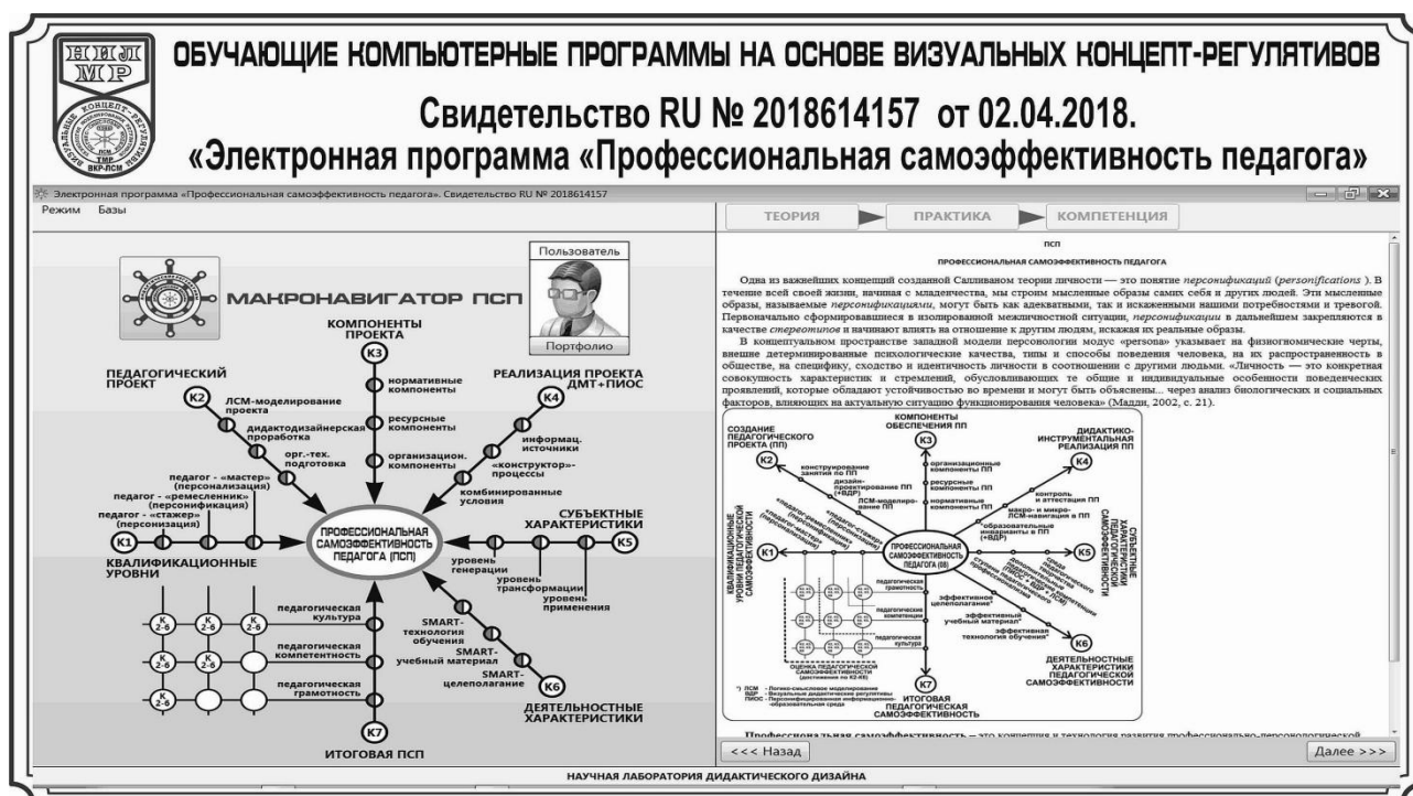
Рисунок 3 – Компьютерная обучающая программа с интерактивным интерфейсом на основе визуального дидактического регулятива

Приоритетность результатов исследований и разработки визуальных дидактических регулятивов обеспечивается заделом, сформированным в процессе предварительных поисковых исследований и опытно-экспериментальной работы, в том числе выполненными диссертационными исследованиями, публикациями в научных изданиях реестра ВАК а также Свидетельствами Федерального института промышленной собственности (ФИПС) на результаты интеллектуальной деятельности (РИД) [12; 13].