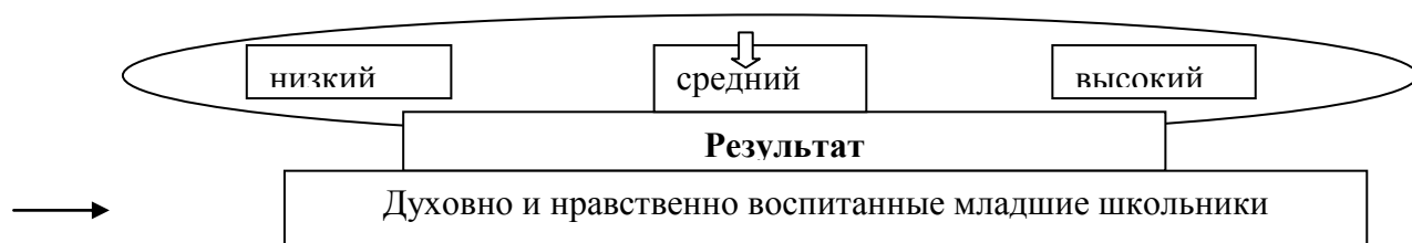
Рис. 1. Модель духовно-нравственного воспитания младших школьников

Ведущей задачей образовательных учреждений и семьи является расширение целенаправленного и контролируемого пространства, обеспечивающего решение задач воспитания личности и создание средствами совместной педагогической деятельности учителей, старшеклассников-кураторов, педагогов дополнительного образования и родителей условий для проявления детьми творчества, самостоятельности, ответственности и духовно-нравственного выбора.