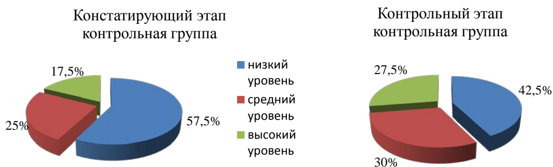
Рис.3. Комплексная оценка уровня коммуникативной креативности студентов контрольной группы

В результате диагностики уровня развития коммуникативной креативности на основе сопоставления показателей, представленных выше, получены данные о повышении уровня данного качества у студентов экспериментальной группы в сравнении с контрольной группой. С целью определения эффективности и достоверности выполненного эксперимента проведена обработка результатов методами математической статистики, а также применен критерий хи-квадрат ( \chi^2 ).