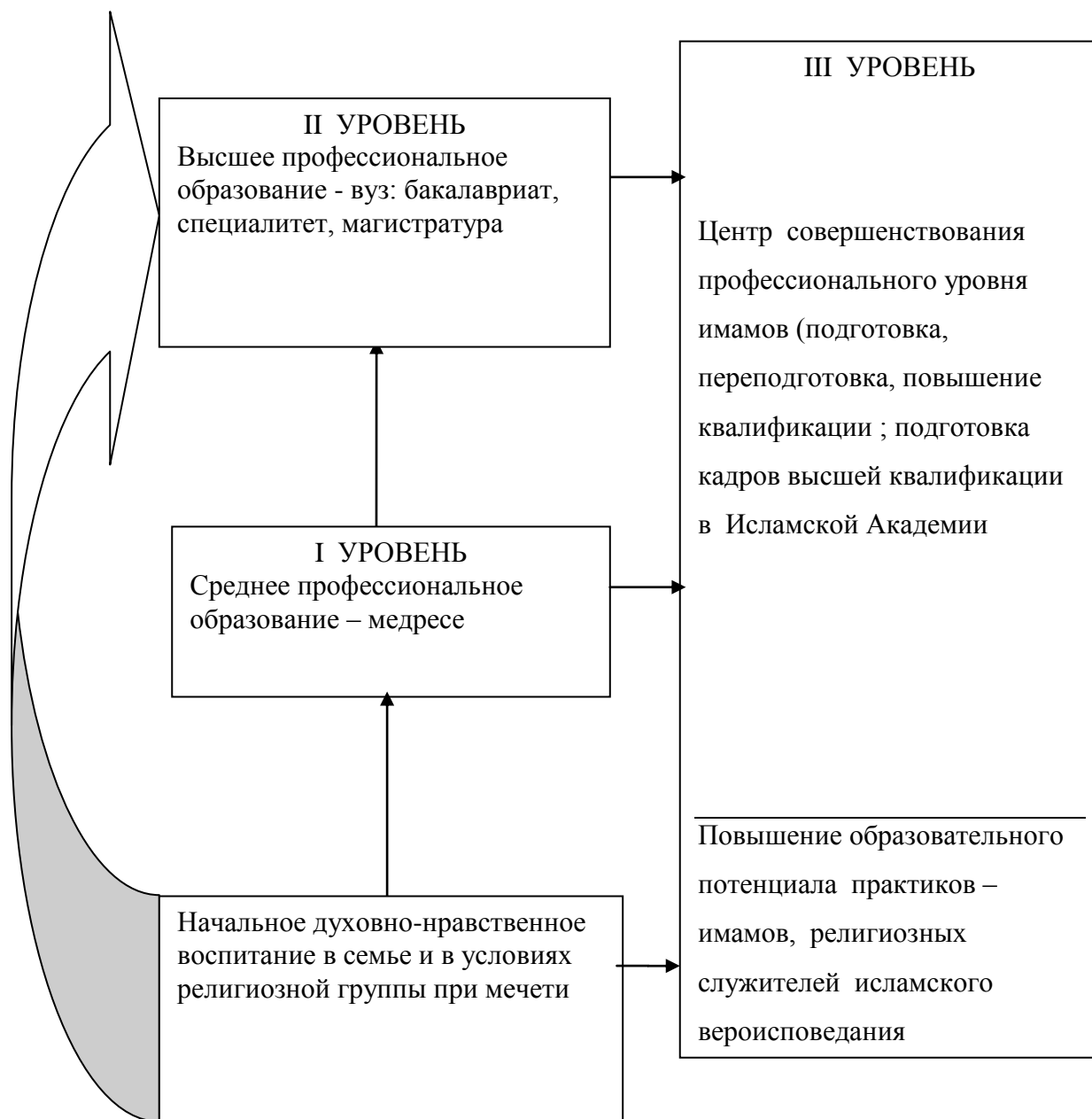
Рис. 3 Структура современного Российского исламского отечественного образования

На рис.3 представлена структура трёхуровневой системы современного исламского отечественного образования [2-4]. Мы считаем, что условием, объединяющим все уровни образования, служит выполнение первого столпа ислама Калима-шахада «Свидетельствую, что нет божества, кроме Аллаха и свидетельствую, что Мухаммад — Его раб и Посланник» [1].