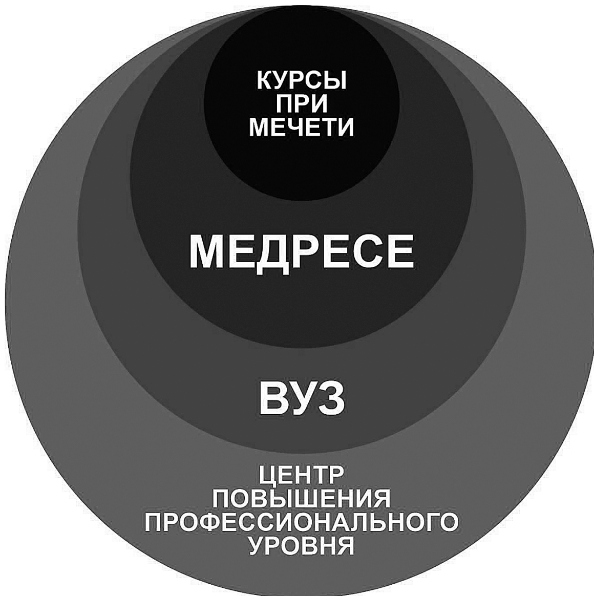
Рис. 4. Преемственность образовательных уровней исламского образования

Важно подчеркнуть, что 3 уровня образования хаактеризуют целостное представление ислама на каждом уровне образования. Уровни исламского образования могут содержать подуровни образования. Таким образом, трёхуровневое исламское образование строится по принципу целостности исламского образования каждого уровня.