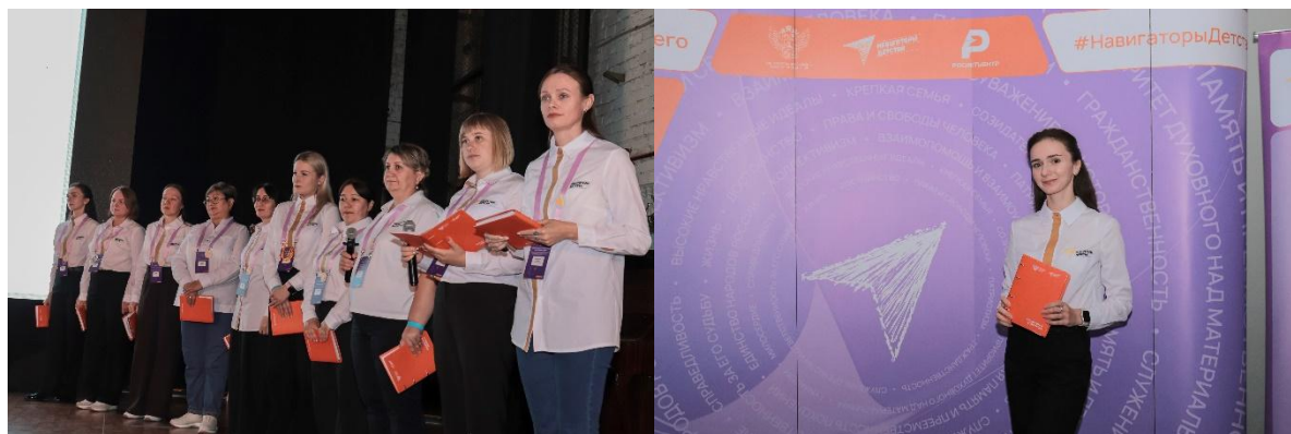
Рисунок 1. Обучение советников в ФГБОУ ВО «Самарский государственный социально-педагогический университет».

обновление и усовершенствование профессиональных навыков, что соответствует требованиям Профессионального стандарта «Педагог» [6].