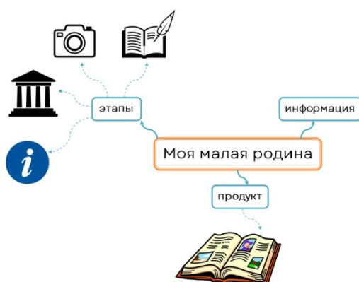
Рис. 2. Создание этапов в интеллект – карте по проекту «Моя малая родина».

В интеллект – картах важно использовать как можно меньше текста, больше наглядности (см. рис.2). Значки, обозначающие тот или иной фрагмент информации целесообразно придумывать вместе с ребёнком, обсуждая и анализируя, поскольку совместная с родителем деятельность позволяет не только устанавливать более доверительные отношения, но и способствует всестороннему развитию школьника.