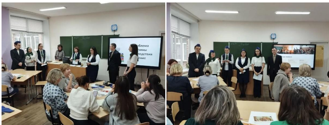
Рисунок 2. Педагогический совет в МОБУ гимназия №5 г. Давлеканово на тему «Наставничество и педагогическое сопровождение молодых педагогов – первый полёт».

Аттестация педагогов служит важным инструментом, позволяющим не только оценить достигнутые результаты, но и определить уровни компетентности, которые должны быть достигнуты для успешной работы в образовании. Оценка профессионального уровня, в свою очередь, влияет на престиж профессии и мотивацию учителей развиваться и осваивать новые навыки.