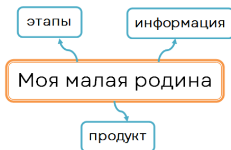
Рис. 1. Начало работы с интеллект – картой по проекту «Моя малая родина».

Как говорилось ранее, интеллект – карта имеет свою структуру: в центр листа выносится основная мысль – тема проекта «Моя малая родина». Все записи ведутся печатными буквами родителями или ребёнком для лёгкости чтения. Далее строятся ответвления к блоку «информация», «продукт» и «этапы» работы над заданием (см. рис.1).