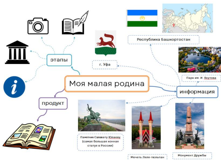
Рис. 4. Завершение работы с интеллект – картой по проекту «Моя малая родина».

Продолжим заполнение ментальной карты на примере города Уфы. Совместно с первоклассником следует найти и выбрать наиболее интересные для него достопримечательности, прочитать исторические данные или захватывающие факты. Немаловажным фактором выступает активная вовлеченность самих родителей в тематику проекта, поскольку именно их искренняя заинтересованность служит основой для мощной мотивационной поддержки ребёнка. Нами было принято решение выбрать: парк им. И. Якутова, Монумент Дружбы, мечеть Ляля-тюльпан и памятник С. Юлаеву – самую большую конную статую в России (см. рис.4).