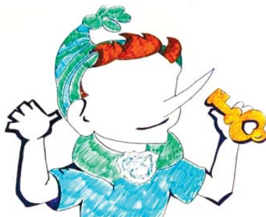
Рис. П2.3. Пример «Буратино»