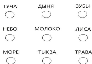
Рис.1 Пример задания по формированию смыслового чтения

сможет правильно выбрать цвет, которым нужно раскрасить кружочек под словом (рис. 2).