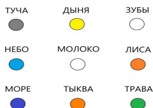
Рис.2 Пример задания по формированию смыслового чтения

Предлагаем к использованию многоразовые трафареты для быстроты и удобства проверки. Когда отдельные слова ученик уже умеет воспринимать семантически целостно, а не как отдельные слова, то происходит переход к предложениям. Все предложения несут в себе какой-либо смысл, натренировать умение читать осознанно будет удобнее на повествовательных предложениях. Одним из наилучших вариантов для формирования навыка осознанного чтения, по нашему мнению, является выбор подходящей картинки под предложение. На карточке написано предложение – Миша и Маша играют с кошкой, а на картинках изображено: на первой Миша и Маша играют в игрушки, на второй Миша и Маша играют с собакой и на третьей они играют с кошкой. Для правильного ответа потребуется соотнести смысл картинок и предложения.