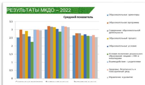
Рис.1. Показатели МКДО - 2022.

Проведённый мониторинг позволил выявить сильные и слабые стороны деятельности образовательных организаций. В 2022 году в дошкольных образовательных учреждениях города зафиксирован 2 уровень – «качество стремится к базовому» по всем показателям мониторинга, что указывает на необходимость целенаправленной систематической работы по повышению качества.