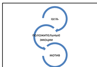
Рис. 1. Механизм преобразования цели в мотив

Акмеологический подход, ориентированный на достижение каждым ребёнком вершин своего развития, имеет возможность реализовать сам механизм превращения цели в мотив [5]. Суть этого механизма состоит в том, что цель, ранее побуждаемая к её достижению каким-либо внешним мотивом (в нашем случае заданием), со временем приобретает самостоятельную побудительную силу, то есть становится внутренним мотивом. Представим сказанное в виде рисунка (рис.1).