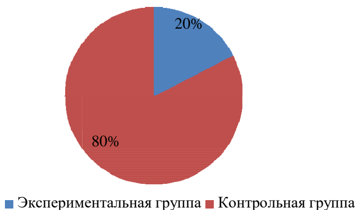
Рис. 2. Сформированность познавательных универсальных учебных действий экспериментальной и контрольной группах (в %).

Пример оформления рисунка представлен ниже.