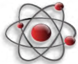
Рисунок 1 – Пример рисунка [4]

текст статьи. Основной текст статьи. Основной текст статьи. Основной текст статьи. Основной текст статьи. Основной текст статьи. Основной текст статьи. Основной текст статьи. Основной текст статьи. Основной текст статьи. Основной текст статьи (рис. 1). Основной текст статьи. Основной текст статьи. Основной текст статьи.