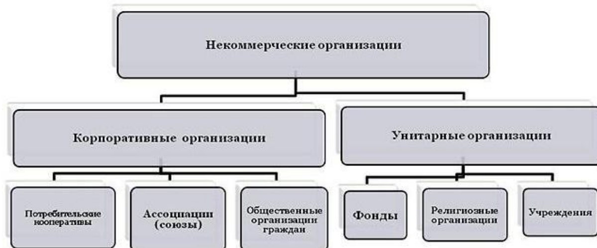
Рис. 2. Некоммерческие организации: корпоративные и унитарные

Собственник имущества унитарного предприятия не отвечает по обязательствам своего унитарного предприятия. Собственник имущества казенного предприятия несет субсидиарную ответственность по обязательствам такого предприятия при недостаточности его имущества.