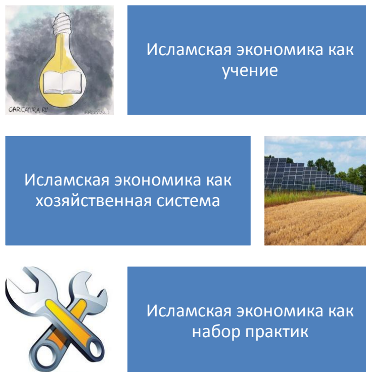
Рис. 1. Содержание термина «исламская экономика»

и государства в целом. Истоки и источники доктрины исламской экономики следует искать в трудах таких видных исламских ученых, как Аль-Газали, Ибн Таймийа, Ибн Хальдун (XI-XV вв.). Вместе с тем, не только религиозно-правовой фундамент Ислама, но и систематизация хозяйственного опыта мусульманской общины, ведет отсчет со времен Пророка Мухаммада и первых халифов. При этом экономическая доктрина раскрывается в источниках шариата (араб. «путь следования») и фикха (араб. «понимание», «знание»). Основными источниками фикха, как известно, выступают Коран и Сунна, изложенная в хадисах. Вспомогательные источники фикха – иджма (единодушное мнение исламских авторитетных ученых) и кыяс (суждение по аналогии).