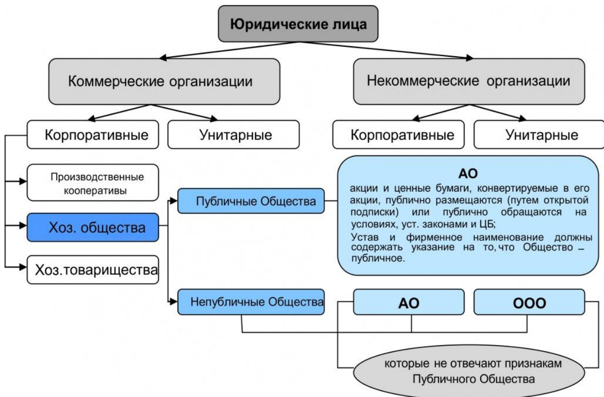
Рис. 1. Организации как юридические лица

В целом к хозяйствующим субъектам в рамках существующих организационно-правовых форм относятся: а) юридические лица; б) организации, осуществляющие свою деятельность без образования юридического лица, в том числе индивидуальные предприниматели.