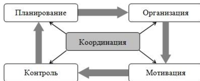
Рис. 1. Взаимосвязь основных функций менеджмента

В теории менеджмента выделяются следующие основные функции: планирование, организация, мотивация и контроль. Это первичные функции, связанные процессами координации и принятия управленческих решений (рис. 1). Управленческое решение – важнейший вид управленческого труда, выражаемый как совокупность взаимосвязанных, целенаправленных и логически последовательных управленческих действий, которые обеспечивают реализацию управленческих задач.