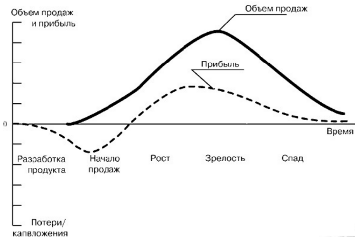
Рис. 2. Время «жизненного цикла продукции» во взаимосвязи с объемами продаж и инвестициями

Итак, производственная и торговая (торгово-посредническая, торгово-закупочная) деятельность это самостоятельные этапы «жизненного цикла продукции». По своему экономическому содержанию торговля входит в стадию обмена экономическими благами.